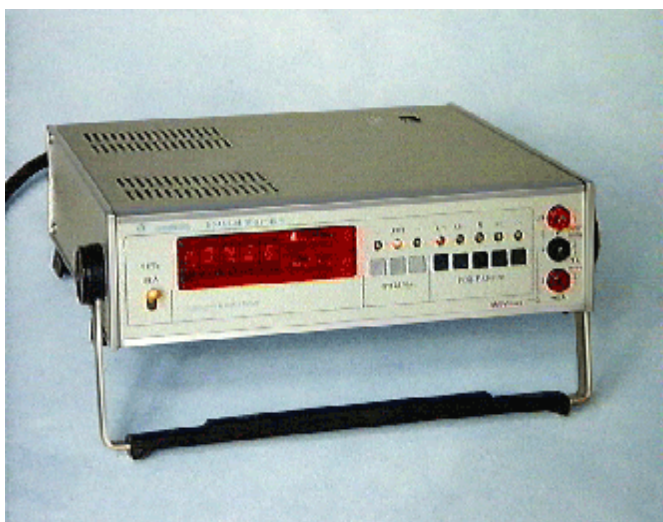
Рисунок 1 – Общий вид вольтметров

Измерение сопротивления осуществляется путем включения его в цепь отрицательной обратной связи усилителя постоянного тока (УПТ), на вход которого через образцовый резистор подается напряжение от источника опорного напряжения. С выхода УПТ напряжение подается на АЦП.